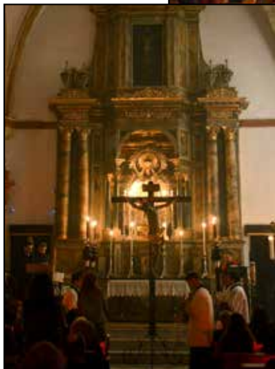
El Viernes de Dolores, el Via+Crucis tuvo que realizarse en el interior del templo debido a las inclemencias meteorológicas, tras el cual, en un ambiente de total recogimiento, se procedió a la subida al paso del Señor, embellecida por los sones de la Capilla Musical "Pasión" y los cantos del Grupo Vocal "Siete Dolores de Ntra. Sra."