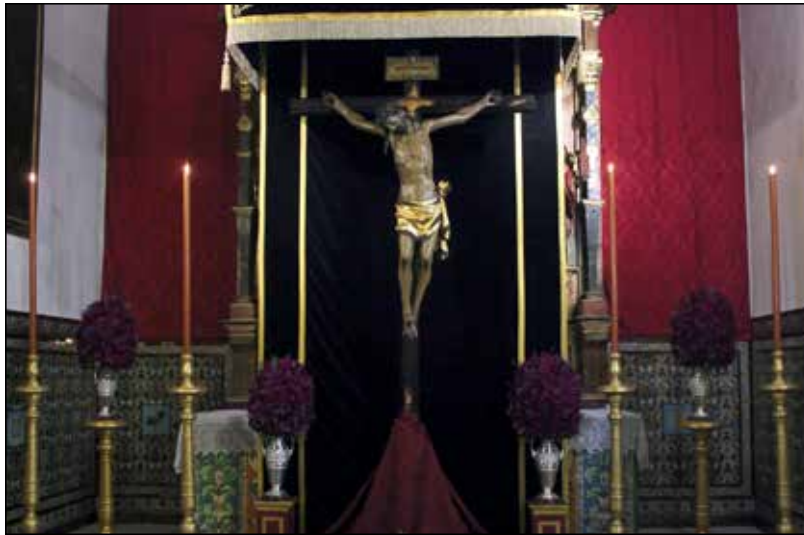
Besapiés al Stmo. Cristo del Perdón el pasado Viernes de Dolores.