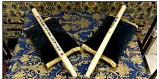
El Viernes de Dolores se concluyó con la bendición y colocación de los cirios votivos que irían en el paso de la Stma. Virgen, los cuales iban dedicados a ANEF y a la asociación LA SONRISA DE LA VIDA.