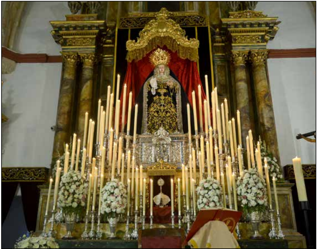
Soberbio altar de cultos a la Santísima Virgen de los Dolores.

El besamanos a la Stma. Virgen de los Dolores volvió a desarrollarse el fin de semana posterior a sus cultos con gran afluencia de hermanos y devotos.