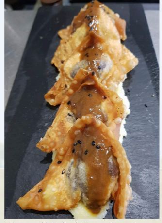
Wantán de Cola de Toro - Casa Pompa

La experiencia gastronómica tiene en La Puebla Del Río todos los alicientes de la Reserva de la Biosfera Doñana, a veinte minutos de Sevilla. El Guadalquivir abajo, buscando la mar, regala escenas que se graban en la memoria. La naturaleza envuelve, y añade magia al disfrute culinario. Los caldos, copas o el tapeo, de raíz marismera, te invitan a formar parte de un pueblo con personalidad y sobre todo, con Arte. El aderezo de unos postres, cafés o meriendas endulzan la visita y te recuerdan que, definitivamente, La Puebla Apetece.